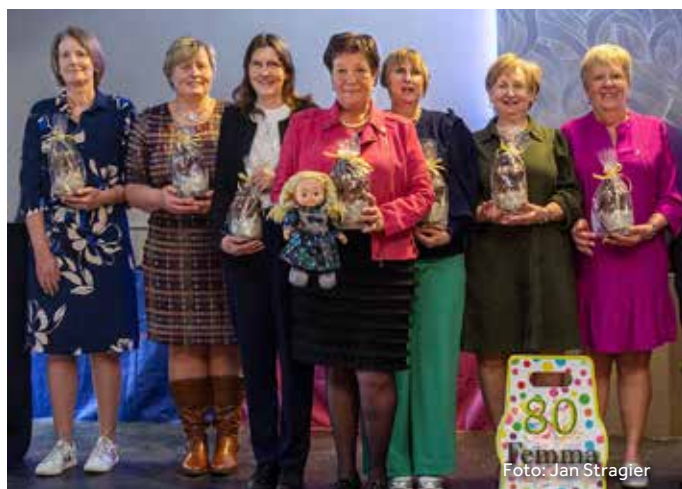
80 JAAR FEMMA