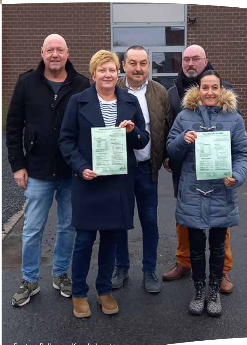
Bestuur Rollegem-Kapelle loopt