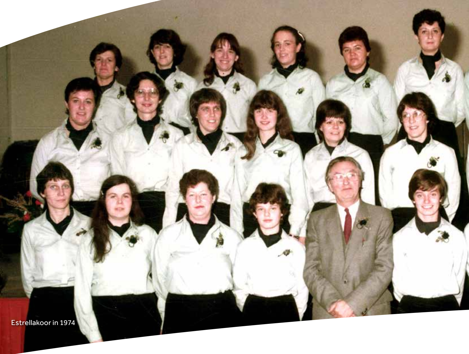
Estrellakoor in 1974