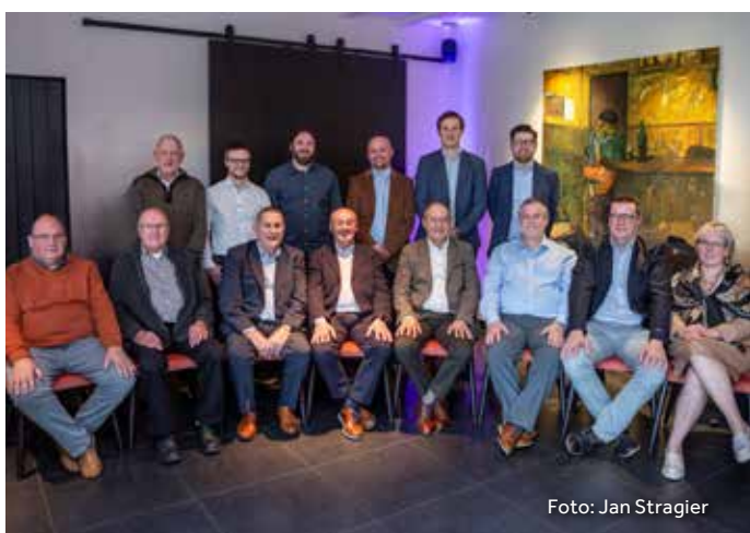
50 JAAR MINIVOETBAL ROLLEGEM-KAPELLE