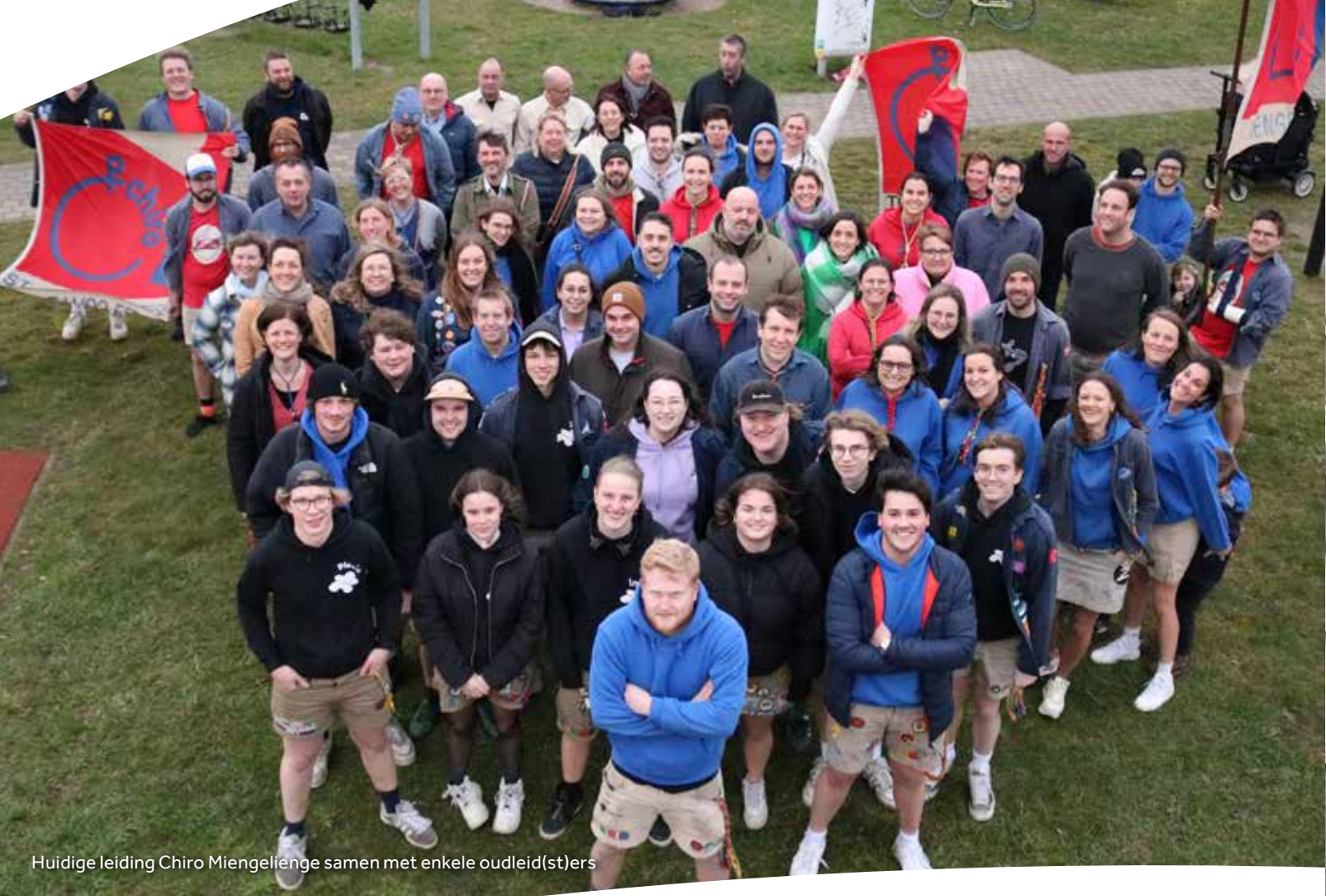
Huidige leiding Chiro Miengeliège samen met enkele oudleid(st)ers