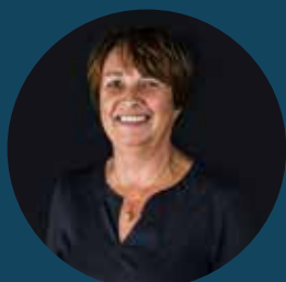
Greta Vandeputte Eerste schepen