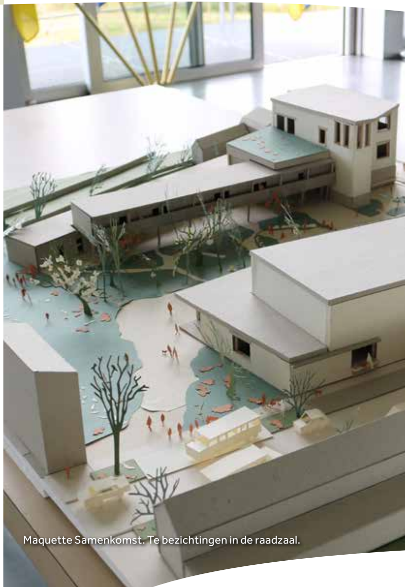
Maquette Samenkomst. Te bezichtigen in de raadzaal.

Team financiën - 056 894 869 - financien@ledegem.be