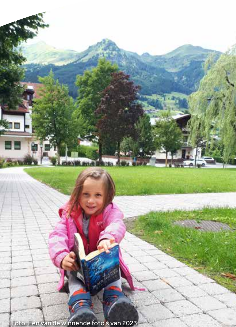
Foto: Een van de winnende foto's van 2023