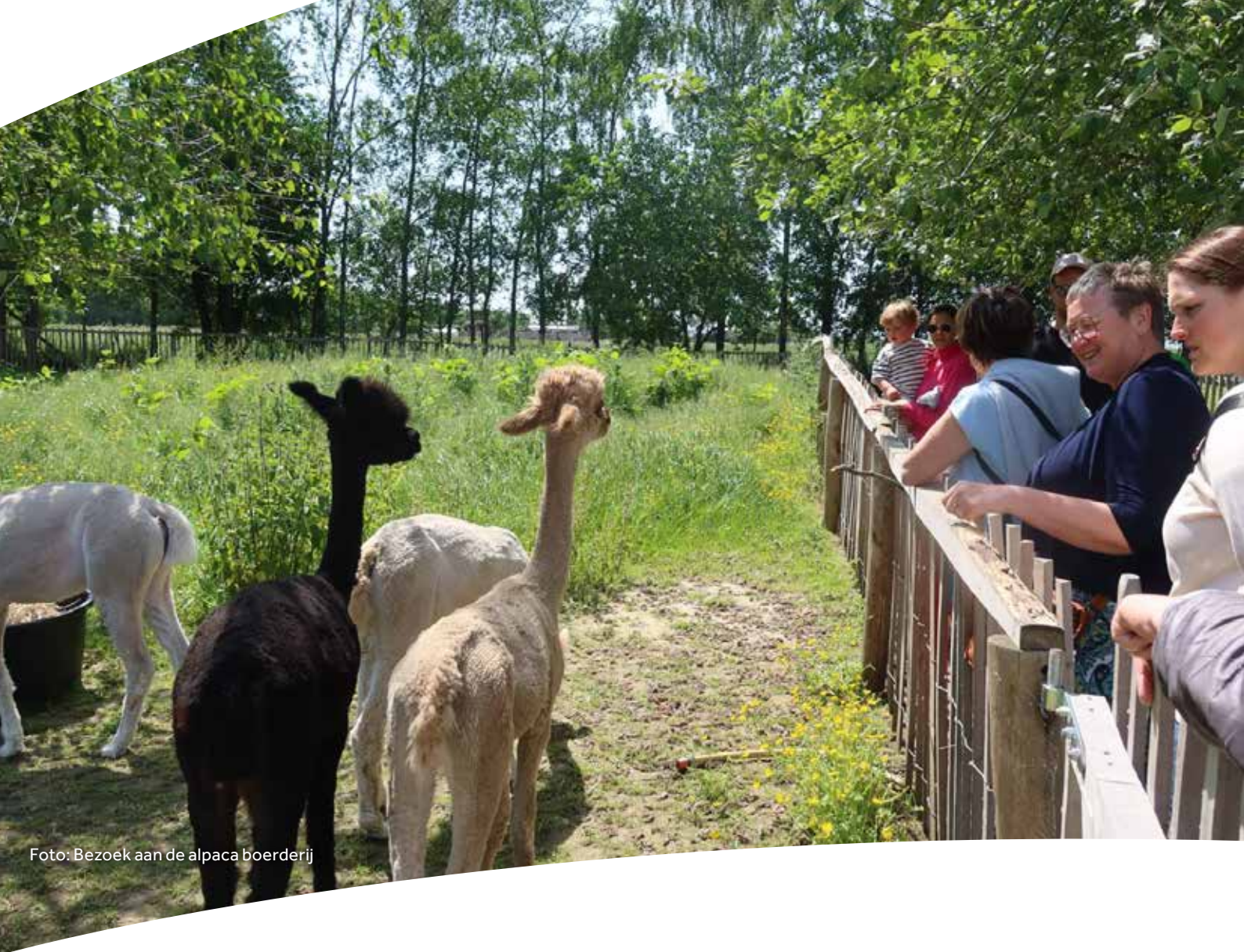
Foto: Bezoek aan de alpaca boerderij