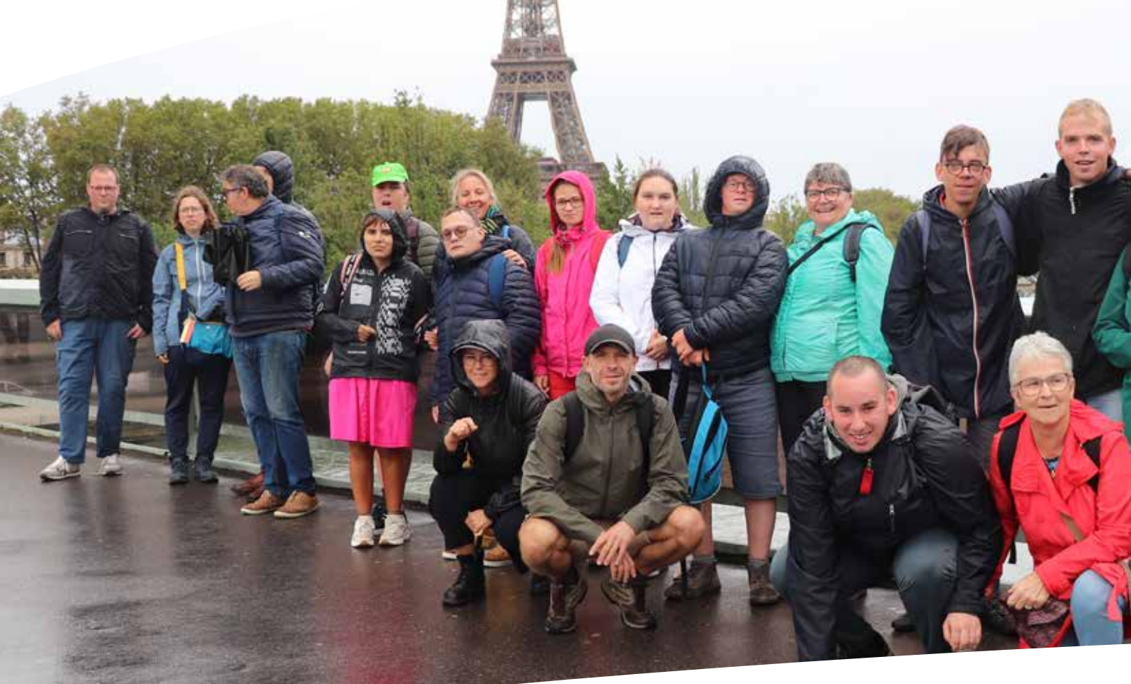
Foto: Op uitstap naar Parijs