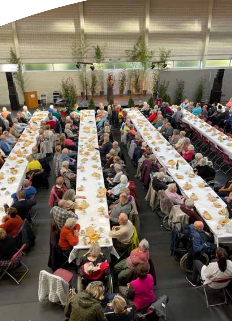
Foto: Ontspanningsnamiddag 2021